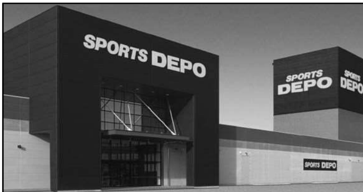
日本最大級!全国に広がる巨大スポーツショップ