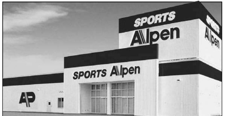
快適なスポーツライフをアルペンがサポートします。